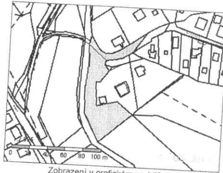
Zobrazení v grafickém prohlížeči

Parcelní číslo: 3089 Výměra [m 2 ]: 2872 Katastrální území: Úvaly u Prahy 775738 Číslo LV: 10001 Typ parcely: Parcela katastru nemovitostí Mapový list: DKM Určení výměry: Ze souřadnic v S-JTSK Druh pozemku: lesní pozemek