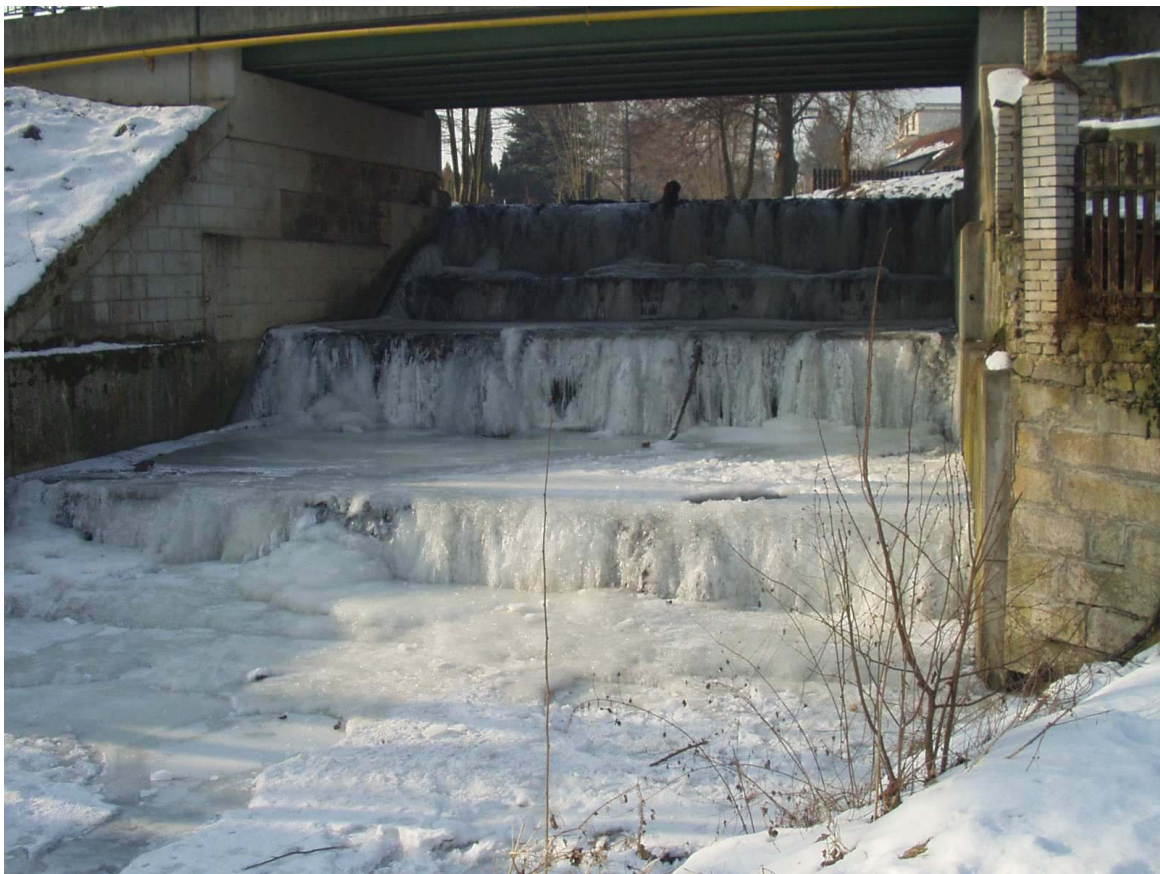
Tuhá zima 2006 postihla i přeliv pod rybníkem Fabrák

Přeliv rybníka Fabrák a přepad z malé zdrže na Přišimaském potoce zde přepadá přes skálu sérií drobných vodopádů a společně se vlévají do Výmoly těsně před vysokým drážním viaduktem. Zdařilá technická stavba i přírodní charakter úpravy vodotečí vytvářejí místo vysoké estetické hodnoty.