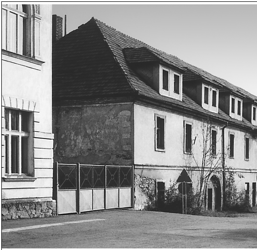
Zaniklý hotel U Českého lva – čp. 9, zbourán v letech 1987/1988