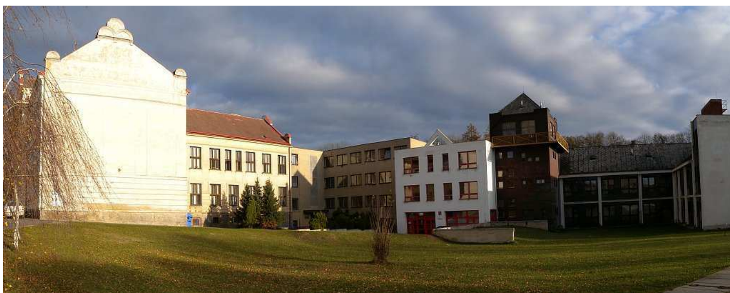
Prologa po hotelu v roce 2011