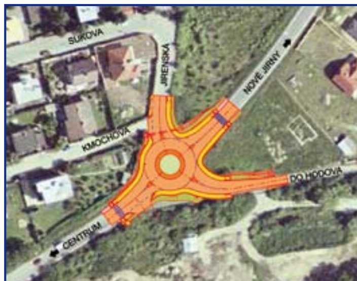
Okružní křižovatka na silnici II/101 - výřez z výkresu přehledné situace poskytl CityPlan, s.r.o., Praha

Odbor investic a dopravy MěÚ Úvaly (informace poskytl Ing. Jan Kubásek, CityPlan, s.r.o.)