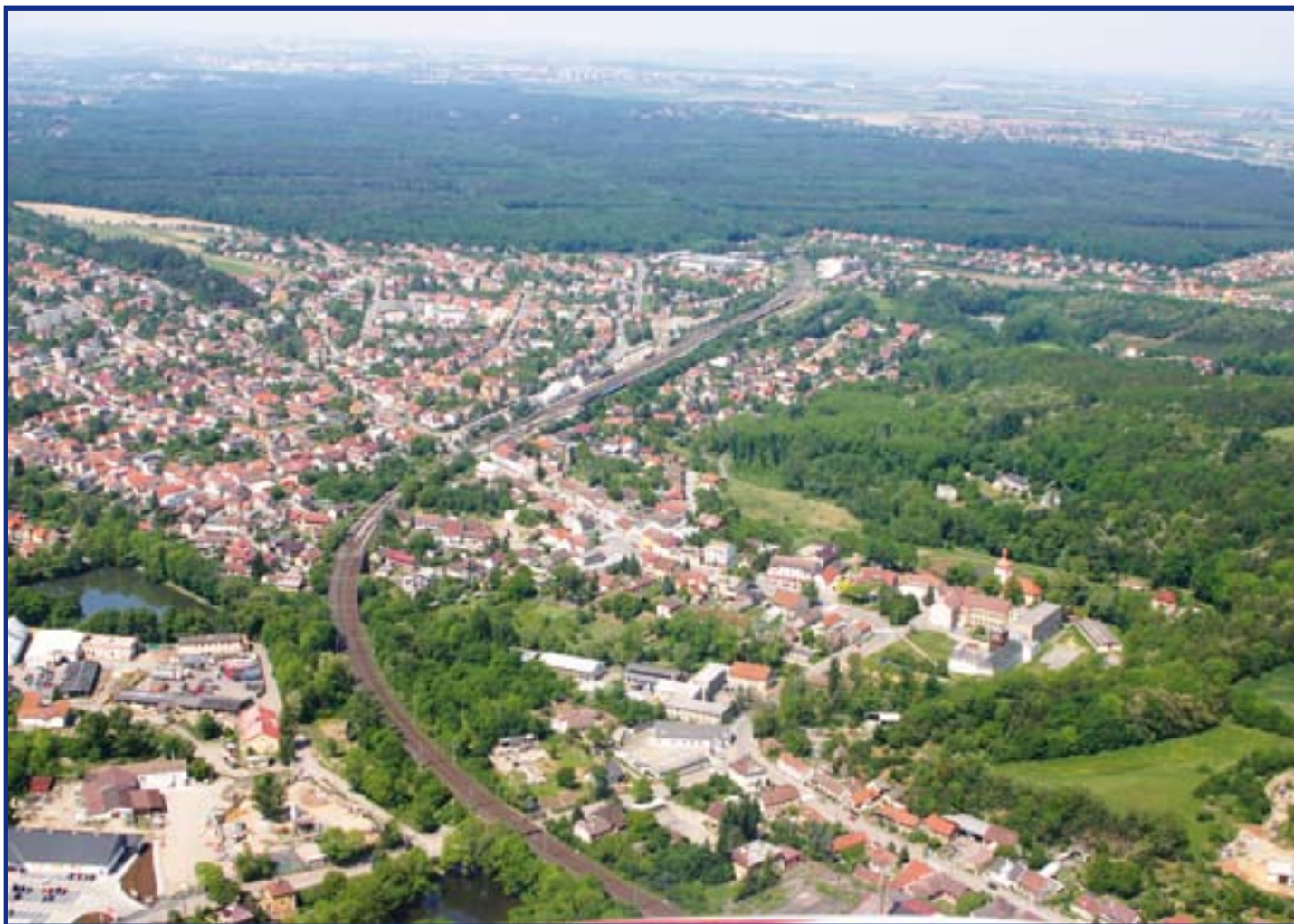
Pohled na Úvaly od jihovýchodu