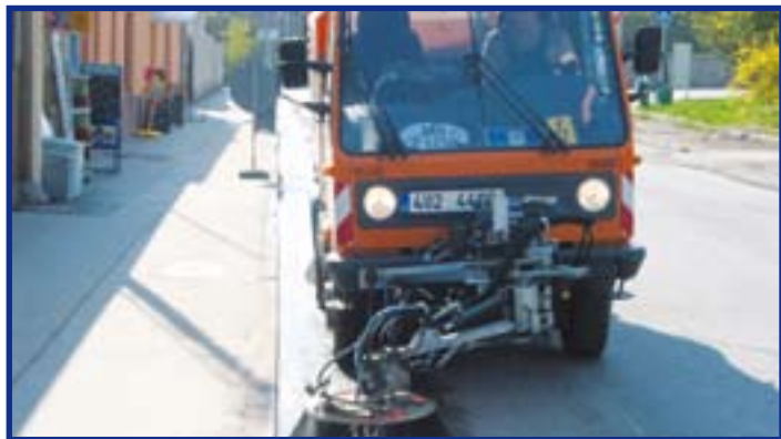
Úklid ulic strojním zametáním Multicarem