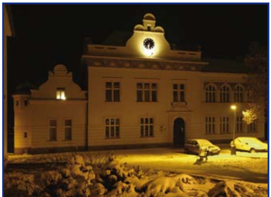
Historická budova ZŠ v Úvalech