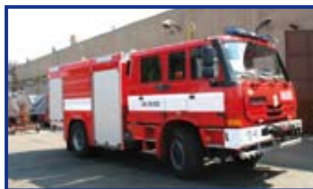
Obrázek vzorového CAS 20