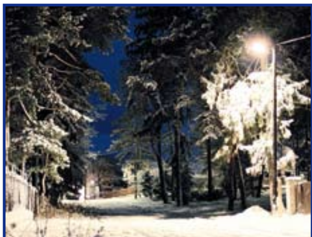
Zima dokáže v Úvalech vytvořit malebná zákoutí