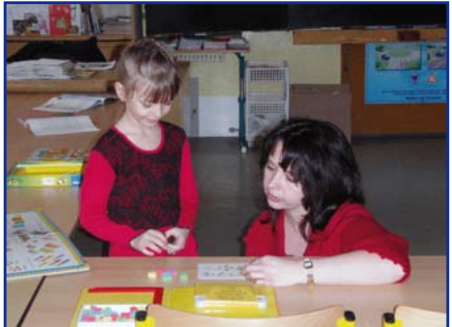
V lednu proběhly zápisy do prvních tříd naší základní školy